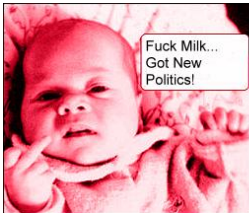
Die Milch machts ...

Wie kommt es dann, dass gerade MILCH dem Körper Kalzium entzieht anstatt ihn damit zu versorgen? Dies ist so, weil Milch neben Kalzium auch jede Menge Phosphate enthält und eine bestimmte Sorte EIWEISS, nämlich KASEIN-EIWEISS. Dieses Eiweiß ist für den Menschen ARTFREMD. Trinkt man Milch, dann bindet die Magensäure 50-70% des Kalziums der Milch, welches somit im Darm nicht aufgenommen wird. Es wird wegen des HOHEN EIWEISSGEHALTES in der Milch noch zusätzlich mehr Kalzium über den Urin ausgeschieden, als durch die Milch aufgenommen wurde. Es findet eine ÜBERSÄUERUNG DES BLUTES statt, denn Milcheiweiß enthält DREIMAL MEHR schwefelhaltige Aminosäuren als pflanzliches Eiweiß. Um eine Übersäuerung des Blutes zu verhindern, muss der Körper reagieren und einen BASISCHEN AUSGLEICH schaffen. Dies tut der Körper, indem er AUS DEN KNOCHEN das basische Kalziumphosphat löst (es also den Knochen ENTZIEHT) und damit die Säurebildung durch das Milcheiweiß zu neutralisieren versucht. Das Endprodukt dieses Stoffwechselforgangs wird über den Urin ausgeschieden. WIE säurehaltig dieser Urin ist, kann man in den öffentlichen Toiletten riechen.